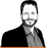
Reto Spiegel Mosaik Kommunikationsagentur

Seien wir ehrlich: Die Art und Weise wie seit Corona-Zeiten auf LinkedIn Nabelschau gehalten wird, ist so was von «linkisch» geworden. Da wird auf Teufel komm raus noch plakativer und reisserischer von sich und seinem Unternehmen geschwärmt, überbordend und in trügerisch «bestem» Licht. Diese Angewohnheit ist bereits Alltag. Aber der Schuss kann auch hinten raus.